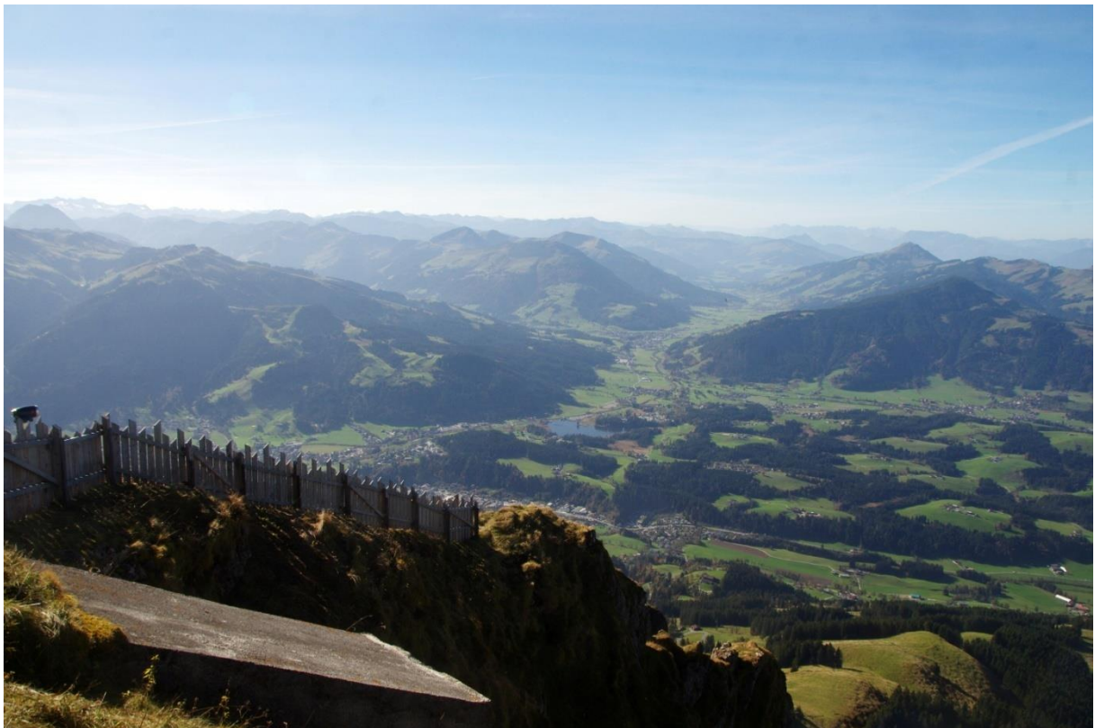
Brixental, Schwarzsee. Ganz links Großer Rettenstein, im Hintergrund Reichenspitze. In der Talverzweigung in Bildmitte Kirchberg. Rechts darüber Hohe Salve, dahinter Rofan und Karwendel