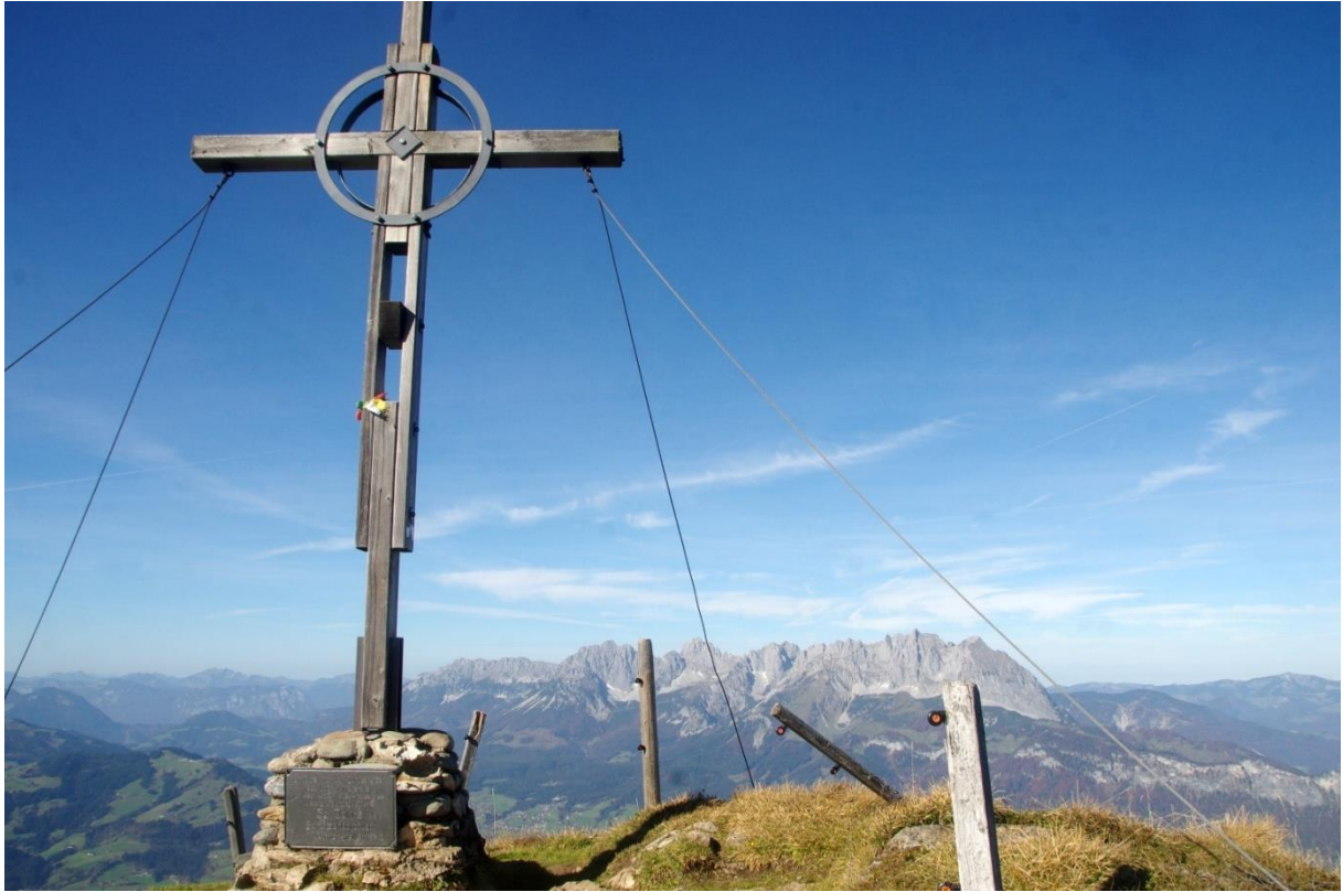
Das im rechten Bild unten durch das Felstor sichtbare Kreuz auf einer Felskanzel