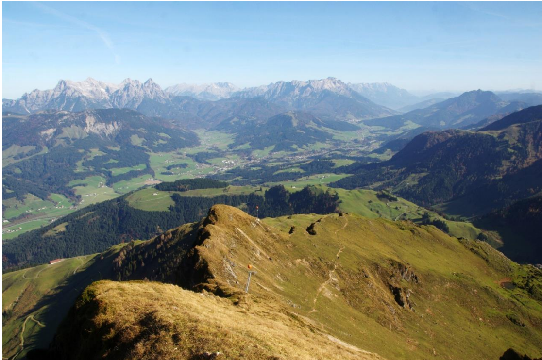
Loferer Steinberge, Watzmann, Leoganger Steinberge, Hochkönig von links