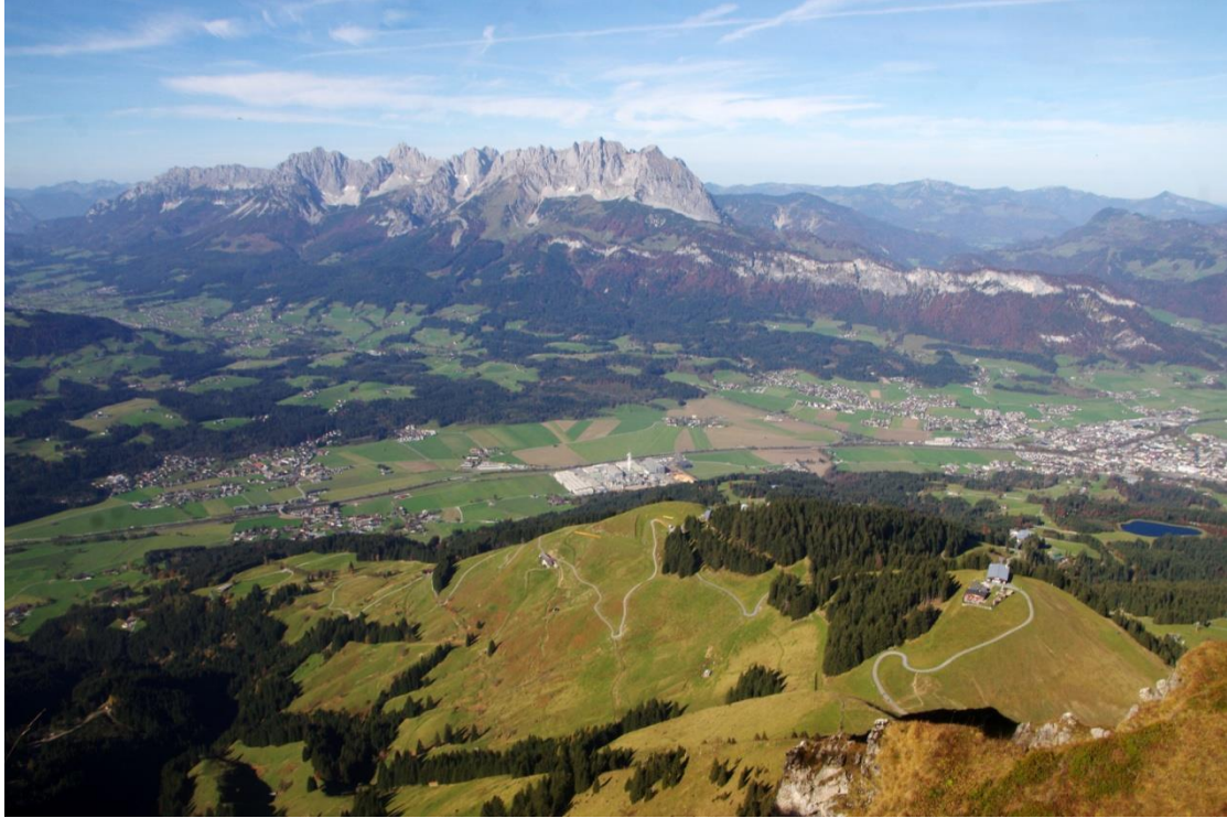
Wilder Kaiser, Harschbichl und St. Johann rechts unten