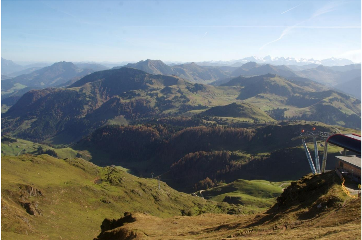
Rechts anschließend an das vorherige Bild: rechts Hohe Tauern mit Wiesbachhorn (li) und Großglockner (re)