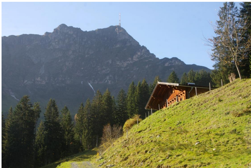
Kröpflalm, Kitzbüheler Horn