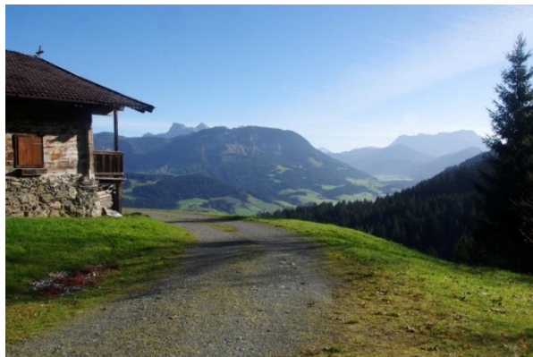
Dechantalm, Blick zu Loferer und Leoganger Steinberge